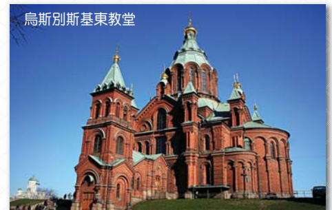
烏斯別斯基東教堂