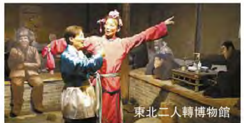
東北二人轉博物館

早餐後專車送往機場辦理登機手續返回原居地城市。(早上09:00發車前往機場) (早)