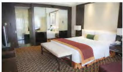
北京人濟萬怡酒店 Courtyard by Marriott Beijing