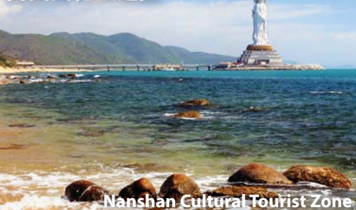
Nanshan Cultural Tourist Zone

種玫瑰花，以“玫瑰之約，浪漫三亞”為主題，五彩繽紛的玫瑰花為載體，集玫瑰種植、文化展示、旅遊休閒度假於一體。【解放路步行街】三亞市內第一條商業步行街，也是三亞文化的象徵之一。銀器店。餐:B/L/D Yetian Guzhai · Rose Valley(include cable car) · Jiefang Road Walking Street