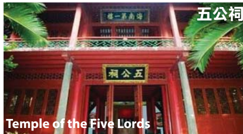
Temple of the Five Lords